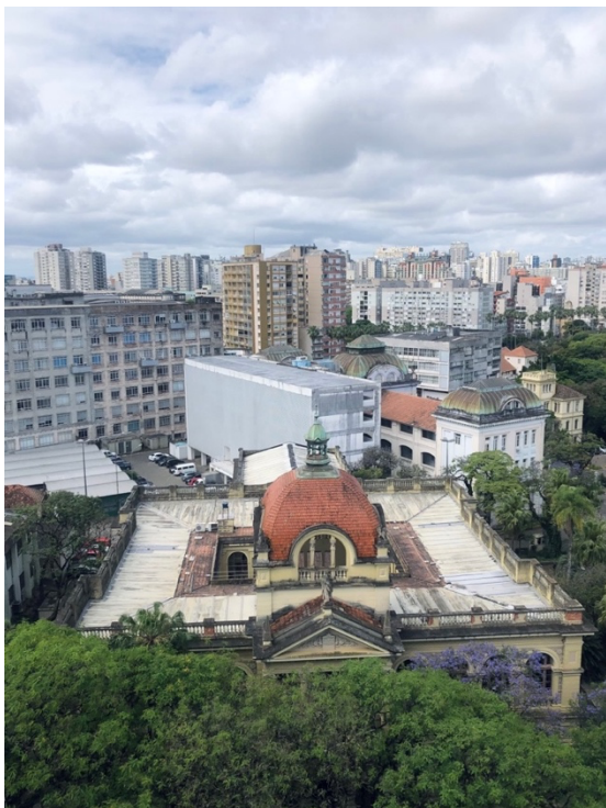
Blick auf den Campus